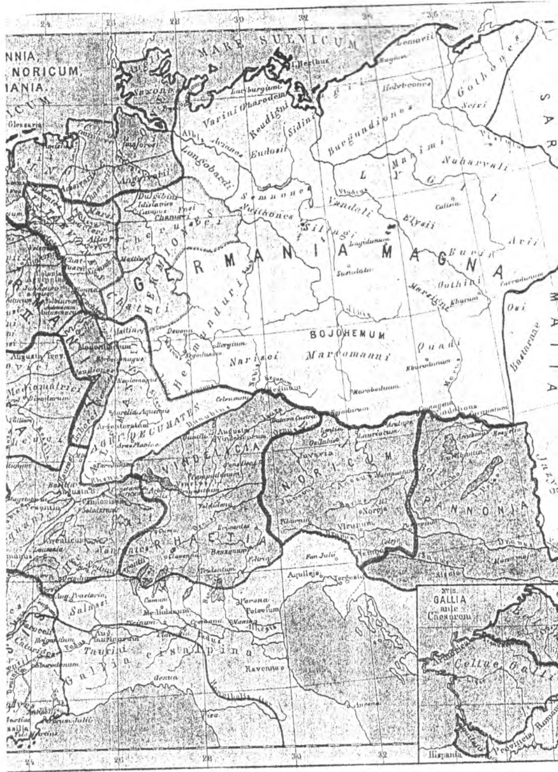
Центральная Европа. I-II вв. н. э. Расселение германских племен Источник: Historischer Schul. Atlas zur alten, mittleren und neueren Geschichte von C. E. Rohde. Auff. 2. Glogau, s. a